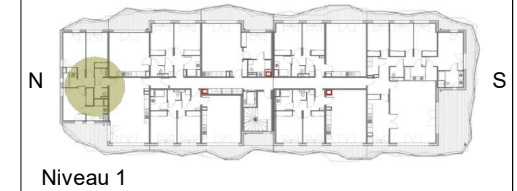
Niveau 1 A12 - T5